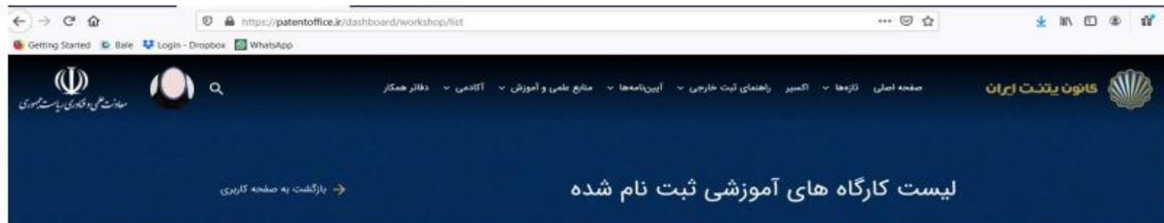
لیست کارگاه های آموزشی ثبت نام شده

مطابق با تصویر (۳)، پس از ورود به لیست کارگاه های آموزشی ثبت نام شده، برای عنوان کارگاهی که فیلد های آزمون و نظر سنجی آن فعال شده است؛ ابتدا فرم نظر سنجی را تکمیل و ثبت نموده و سپس آزمون را شروع نمایید.